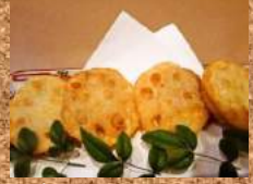
レンコンのはさみ揚げ