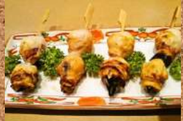
イカとんび炭火焼