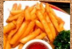
スパイシーポテト